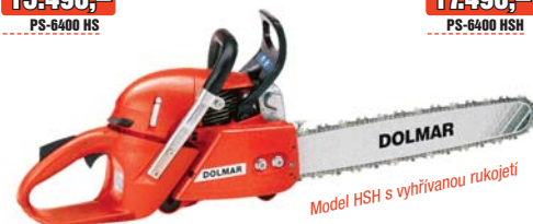
Model HSH s vyhřívanou rukojetí

19.690,- 15.490,- PS-6400 HS 20.090,- 17.490,- PS-6400 HSH