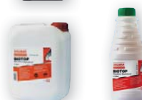
Biologický olej BIOTOP