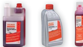
Motorový dvoutaktní 1:50