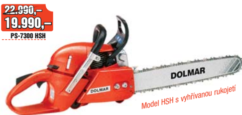
Model HSH s vyhřívanou rukojetí

21.990,- 17.990,- PS-7300 HS 23.890,- 19.990,- PS-7900 HS