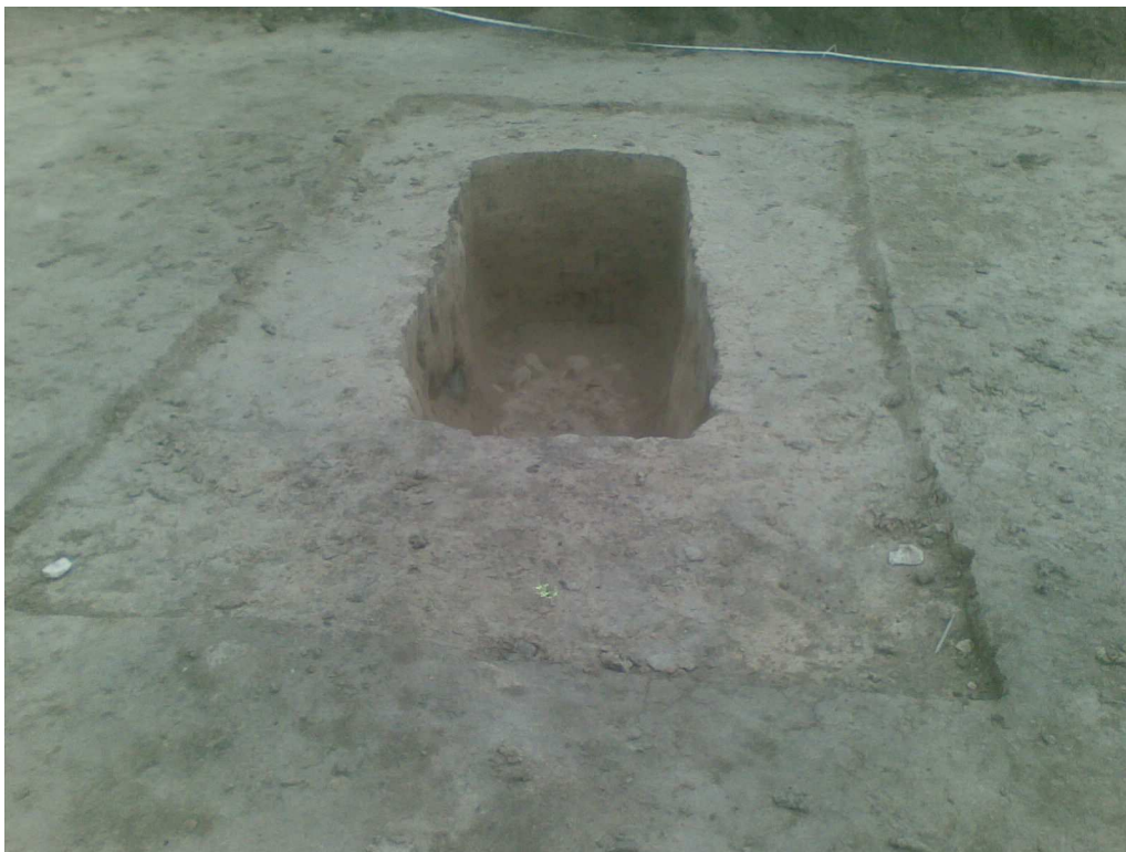
Pohled na odkrytý hrob

Po odkrytí zkoumané plochy bylo prokázáno, že se skutečně jednalo o hrob z období r. 400 – r.50 př.n.l.